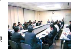
キックオフミーティング