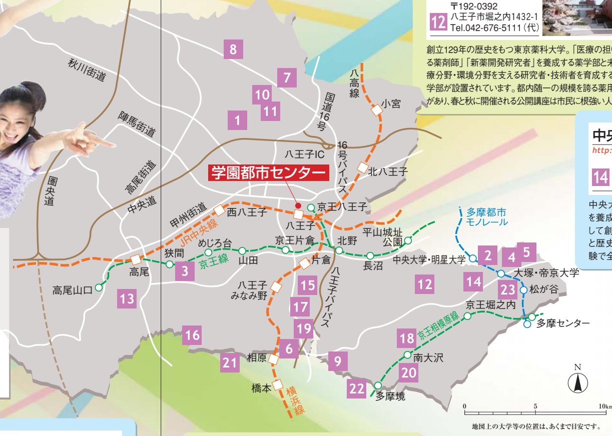
地図上の大学等の位置は、あくまで目安です。