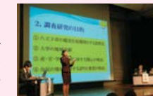
学生と市長とのふれあいトーク

「八王子学園都市大学いちょう塾」、「学生と市長とのふれあいトーク」等の支援や、「八王子未来学」で研究されたテーマに関する講座の実施について検討する。