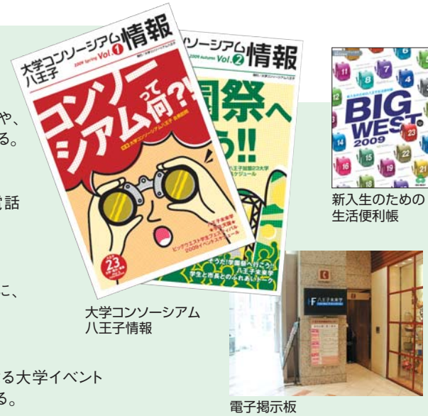
大学コンソーシアム八王子情報

市施設に配置される「八王子未来学」の電子掲示板による大学イベント情報などの情報発信事業を支援し、引き継ぐ環境を整備する。