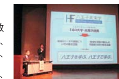
キックオフセミナー

大学コンソーシアム八王子の中核事業として、10年後には 1. 地域のシンクタンクとなる「知の拠点」の形成 2. 地域全体が学びの場となる「まるごとキャンパス八王子」の実現を目指しています。