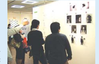
学生の研究やアイデアの発表