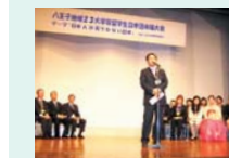
留学生日本語弁論大会

他団体が行っている賃貸住宅保証制度を研究し、コンソーシアムで機関保証できないか調査研究を行う。